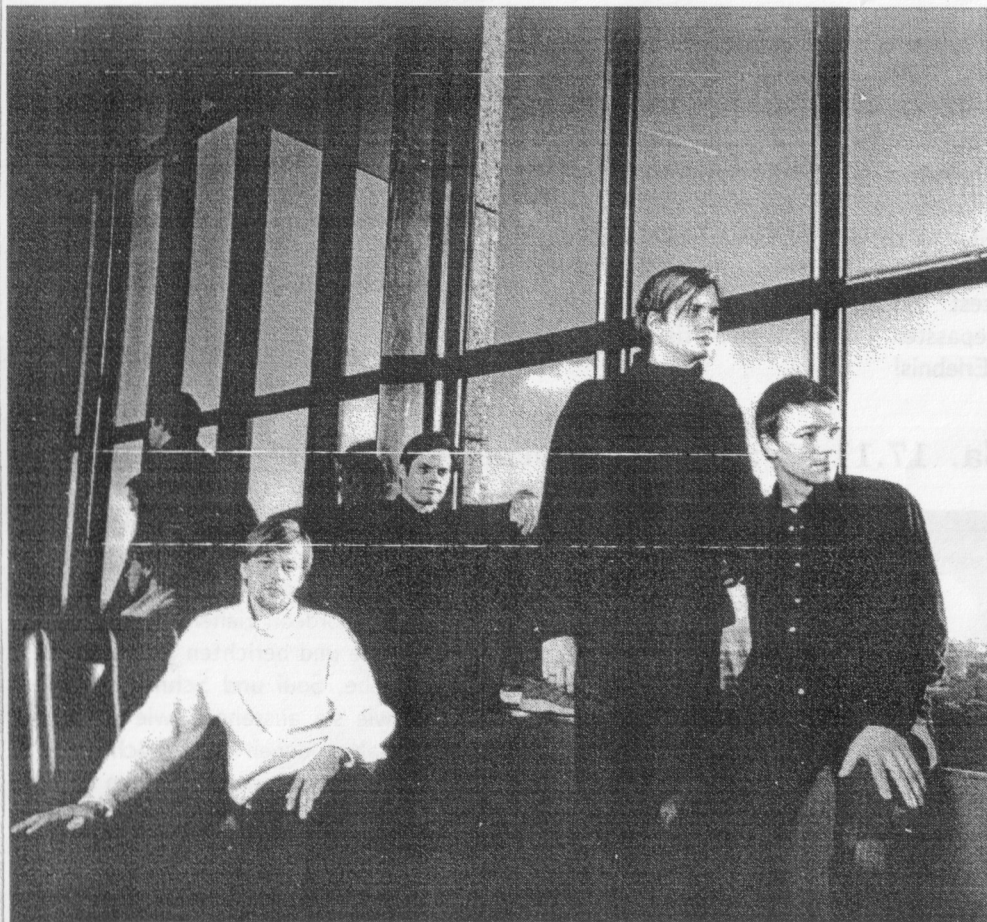
BLUMFELD — foto: Dorle Bahlburg